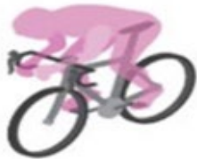
Image 3: Forbidden positions in all races: