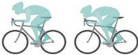
Image 2: Allowed position only in draft illegal races: